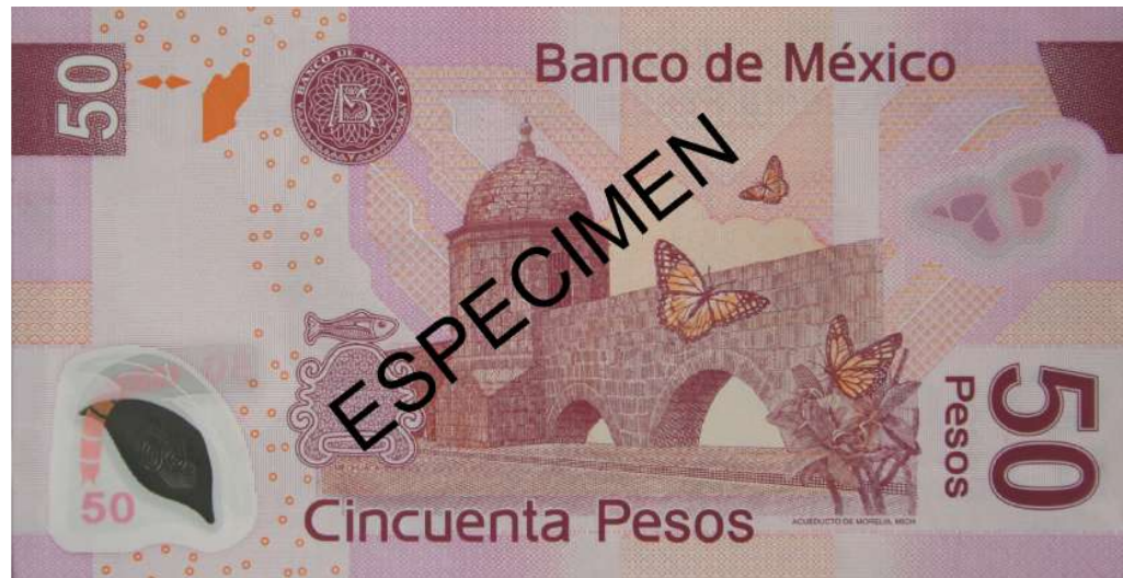
REVERSO ACUEDUCTO DE MORELIA