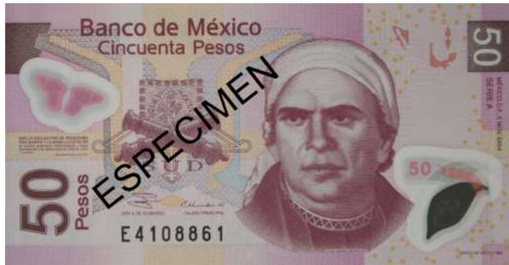
ANVERSO JOSÉ Ma. MORELOS