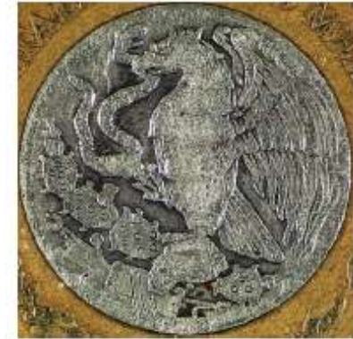
Pieza auténtica Deteriorada

Bordes redondeados en la unión del centro con el anillo perimetral (borde recto en la auténtica)