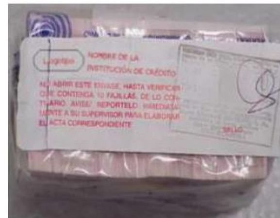
Ejemplo de etiqueta de mazo