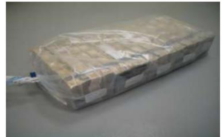
Ejemplo de Bolsa