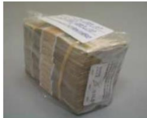
Ejemplo de Mazo