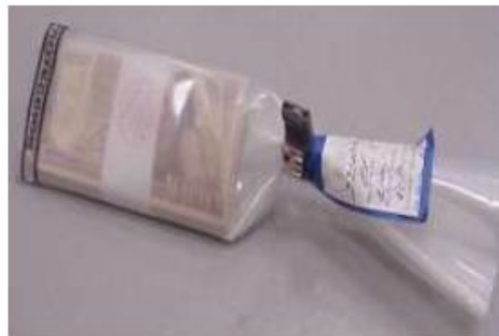
Ejemplo de Fajilla