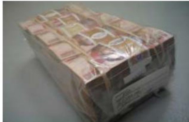
Ejemplo de Paquete