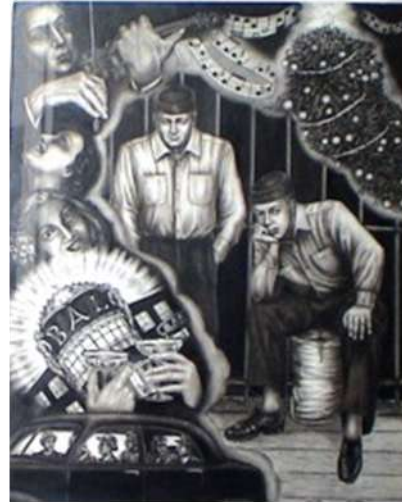
Dibujos elaborados a lápiz por Enrico Sampietro