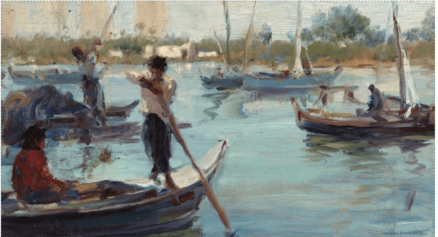
Untitled Kamel Moustafa circa late 1940s