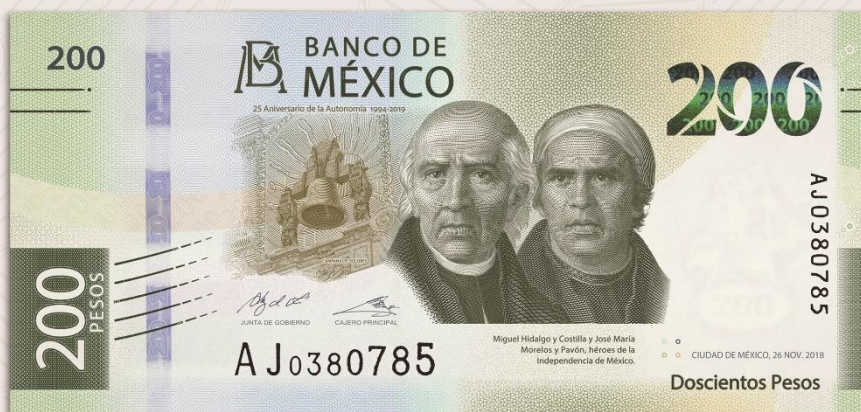
ANVERSO: Proceso histórico de la Independencia de México.