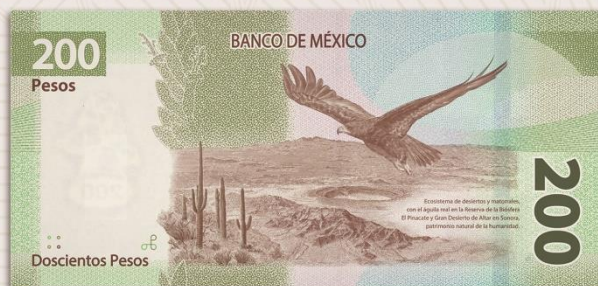
REVERSO: Ecosistema de desiertos y matorrales.

Para mayor información: Visita: www.banxico.org.mx Llama sin costo al: 800-BANXICO (800-226-9426) Contáctanos en: dinero@banxico.org.mx Descarga la app: BilletesMX