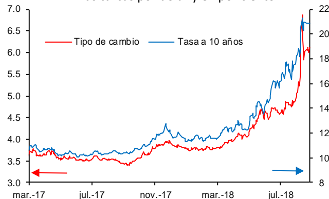
Gráfica 1 Tipo de Cambio y Tasa de Bonos Soberanos a 10 años Liras turcas por dólar y en por ciento

Nota: Datos al 27 de agosto de 2018.